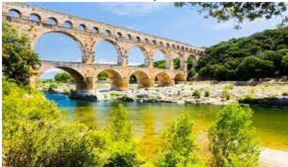
Ponte du Gard "ponte romano"