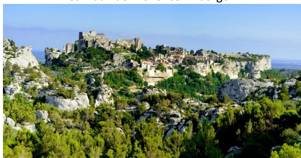
Les Baux de Provence "il borgo"